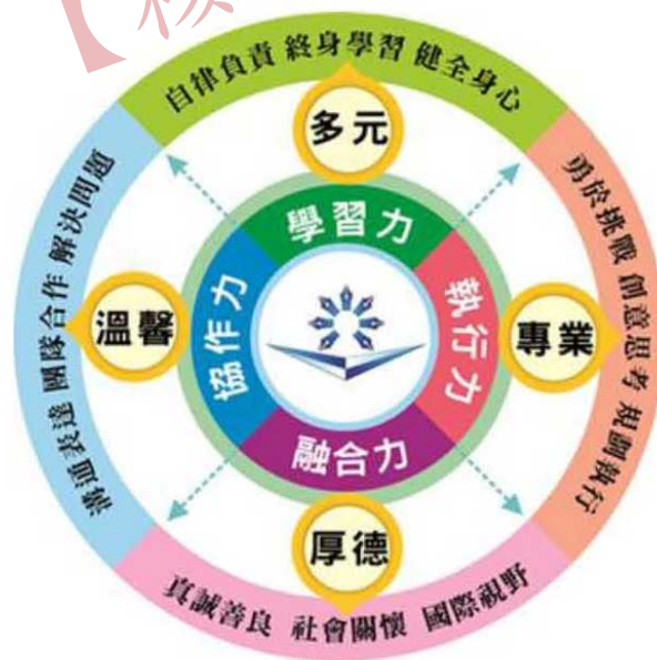
圖1 鼓山高中學校願景、學生圖像及校本核心能力示意圖

為契合十二年國民基本教育課程綱要及因應新課綱的實施，在蒐集各領域的想法，統整歸類和討論後，建構出鼓山高中的校本課程學習地圖，以及「學習力、執行力、協作力、融合力」的學生圖像。並於學習力、執行力、協作力、融合力的學生圖像上，以「學生學習、適性揚才」為推動的核心主軸，透過教師公開觀課和共備社群的積極運作，發展精緻化的特色課程，憑藉高中三年的學習生涯，打造具備面對未來的素養核心能力的學生，達到學校與師生永續發展之目的。