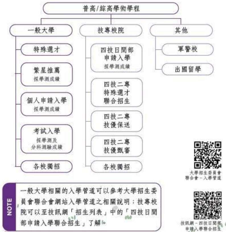
圖1-普通型高中及綜合型高中學術學程學生的升學管道