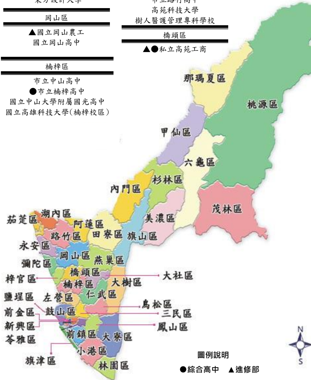
圖例說明 ● 綜合高中 ▲ 進修部