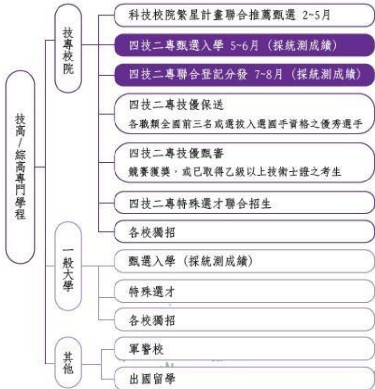
圖2-技術型高中及綜合型高中專門學程學生的升學管道