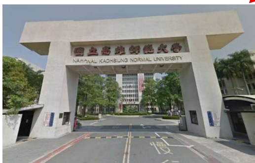
國立高雄師範大學 (地址：高雄市苓雅區和平一路 116 號)