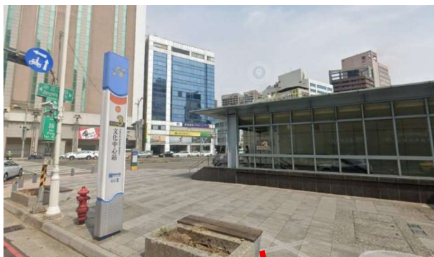
文化中心 3 號出口