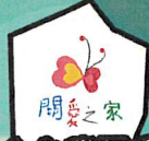
財團法人台灣關愛基金會